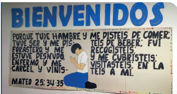
Dit hangt aan de muur van het Centro de Escucha. In Mattheüs 25 laat Jezus zien dat Hijzelf aanwezig is in de geringsten van Zijn broeders. Wie zich over hen ontfermt, ontmoet Hem. Dat is een diepe gedachte.