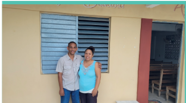
Orkaan Melissa heeft Cuba zwaar getroffen. Heel veel mensen hebben hun huizen en bezittingen verloren, en ook veel broeders en zusters lijden onder de gevolgen. Bid alstublieft voor Cuba, om Gods zegen over het land, en dat mensen die zegen juist in deze omstandigheden mogen ervaren.

Daarnaast steunt de GZB gemeenten van de CBCOR door bijvoorbeeld diaconale projecten mogelijk te maken. Want er is grote schaarste op Cuba: aan voedsel, medicijnen en elektriciteit. Er zijn bijvoorbeeld initiatieven om de meest kwetsbaren, zoals ouderen, regelmatig van eten te voorzien.